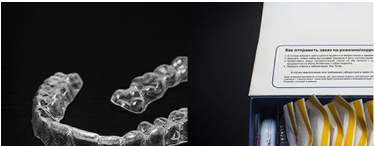
照片：矫正器是透明的，几乎看不到牙齿。

Star Smile是俄罗斯矫正器制造商市场的领导者：公司在市场上的销售量排名第二，模拟生产数量排名第一。在Star Smile的账户上，有超过5万个使用矫正器的治疗案例。Star Smile与其他公司的区别在于它的治疗过程的虚拟仿真，以及它自己的生产技术，在美国联邦行政部门之一-食品和药物管理局注册。此外，该公司有自己的诊所和学校网络，来自不同国家的专家在那里接受生产技术培训并使用矫正器。