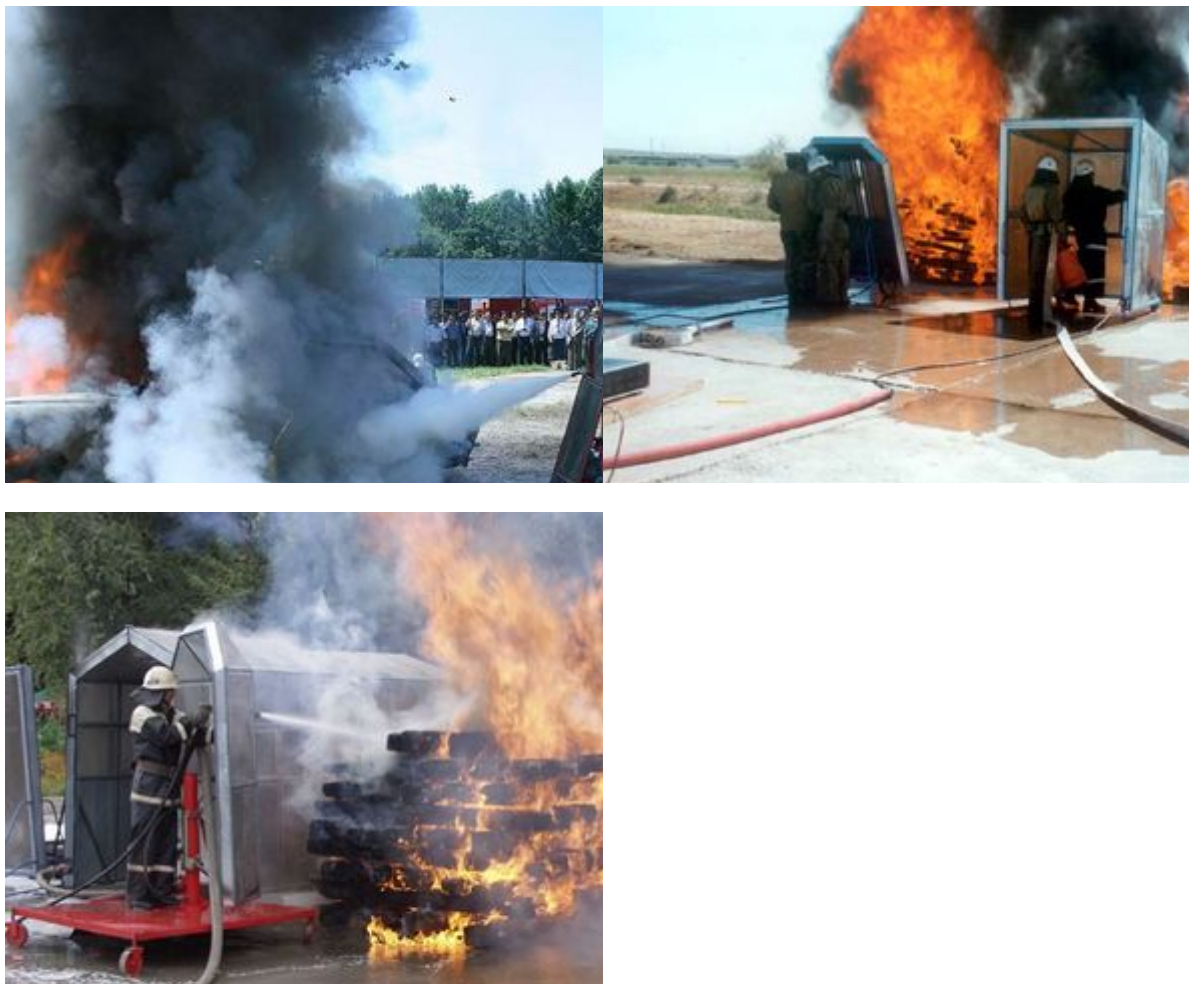
UNIQUE FEATURES OF SHIELDS