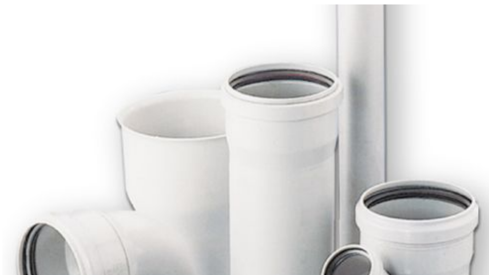
Фото: Внутренняя канализация с пониженным уровнем шума