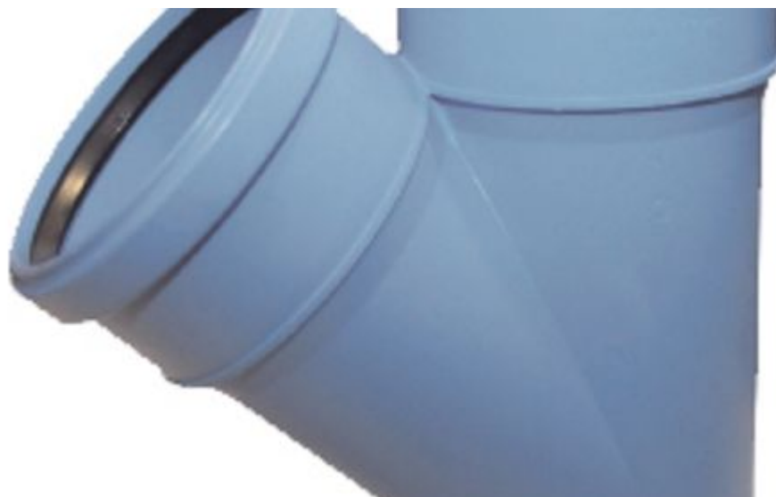
Фото: Системы внутренних водостоков