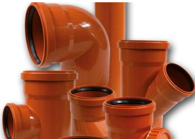
Фото: Система наружной канализации