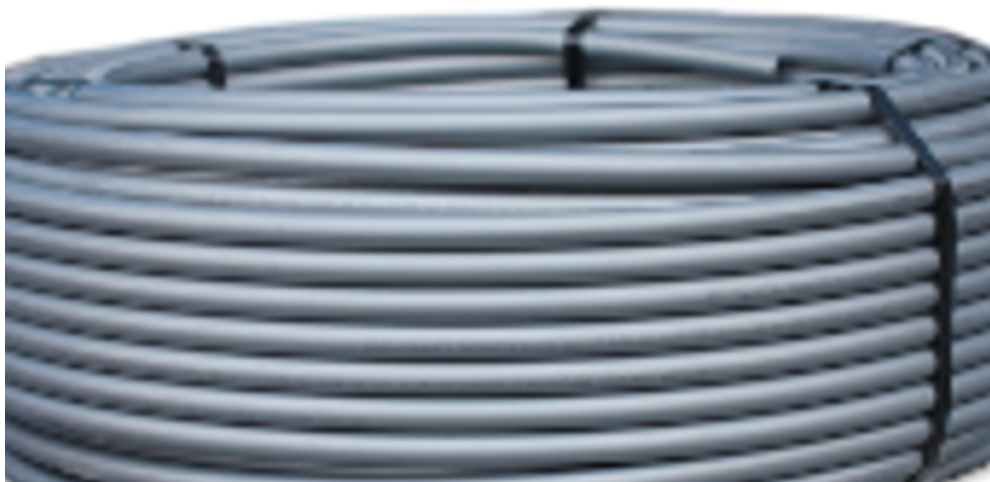
Фото: Труба для низкотемпературного отопления, водоснабжения и системах водяной теплый пол

Продукция Синикон обладает рядом неоспоримых преимуществ по сравнению с системами как из традиционных материалов (чугун), так и с системами из других полимерных материалов (НПВХ и полиэтилен):