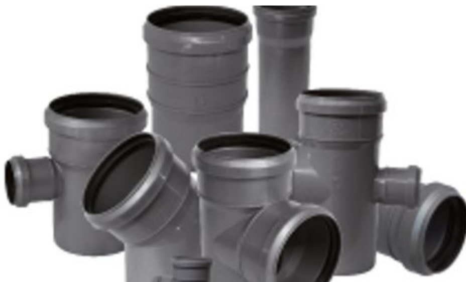
Фото: Полипропиленовая система внутренней канализации

температурой 80°C (кратковременные стоки до температуры 95°C).