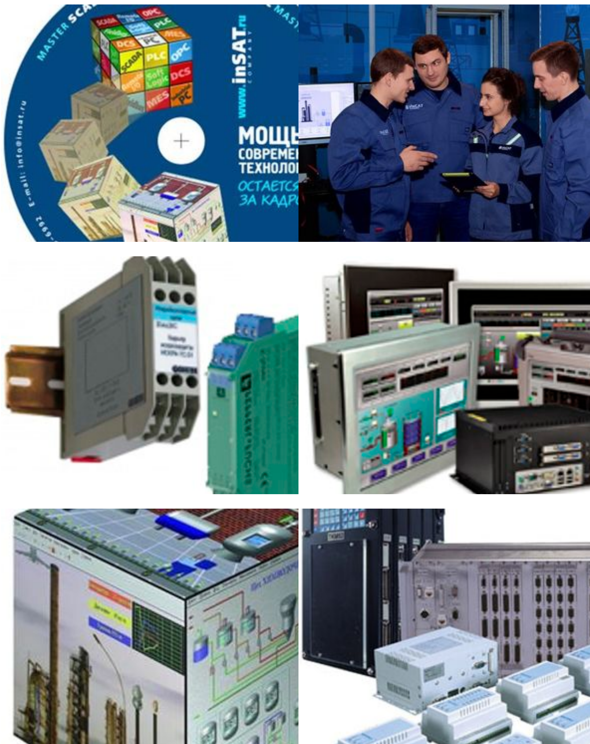
1. Крупнейший поставщик ПО для систем автоматизации и