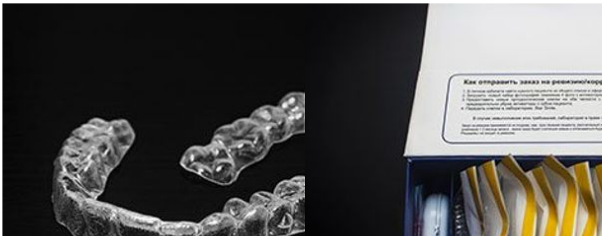
Фото: Элайнеры прозрачны и почти незаметны на зубах