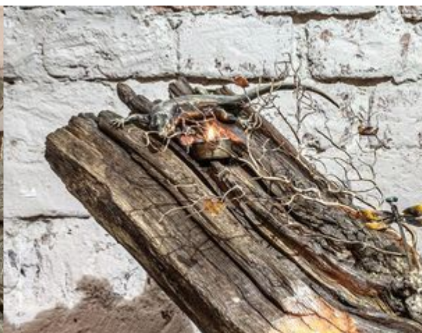
写真。バランとトンボ