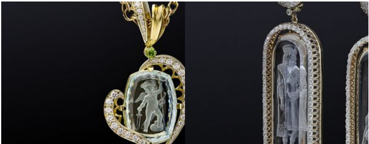
写真。インターリウム"アムール"を使ったサスペンション

凹版画の芸術は、石彫の中でも最も古い技法の一つです。イタリアの2つのタイプがあります - 逆と直接。彫りの技術の違いは些細なもので、逆凹版は透明な石の裏面の鏡面反射で行われ、直凹版は通常不透明または透明度の低い石の表面に彫られます。凹版の作成の技術は千年の間に変更されていません。技術革新の中で - 電気駆動、顕微鏡、唯一の製品の製造時間を短縮することができたダイヤモンドツール、。現在、それは1平方センチメートルの凹版を作成するために約1ヶ月かかります。